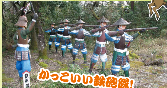
かっこいい鉄砲隊!